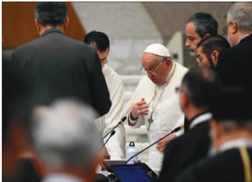
Papież w Auli Synodalnej

Stawiając na nowo w centrum pytanie Papieża, które było powodem zwołania Ekumenicznego Soboru