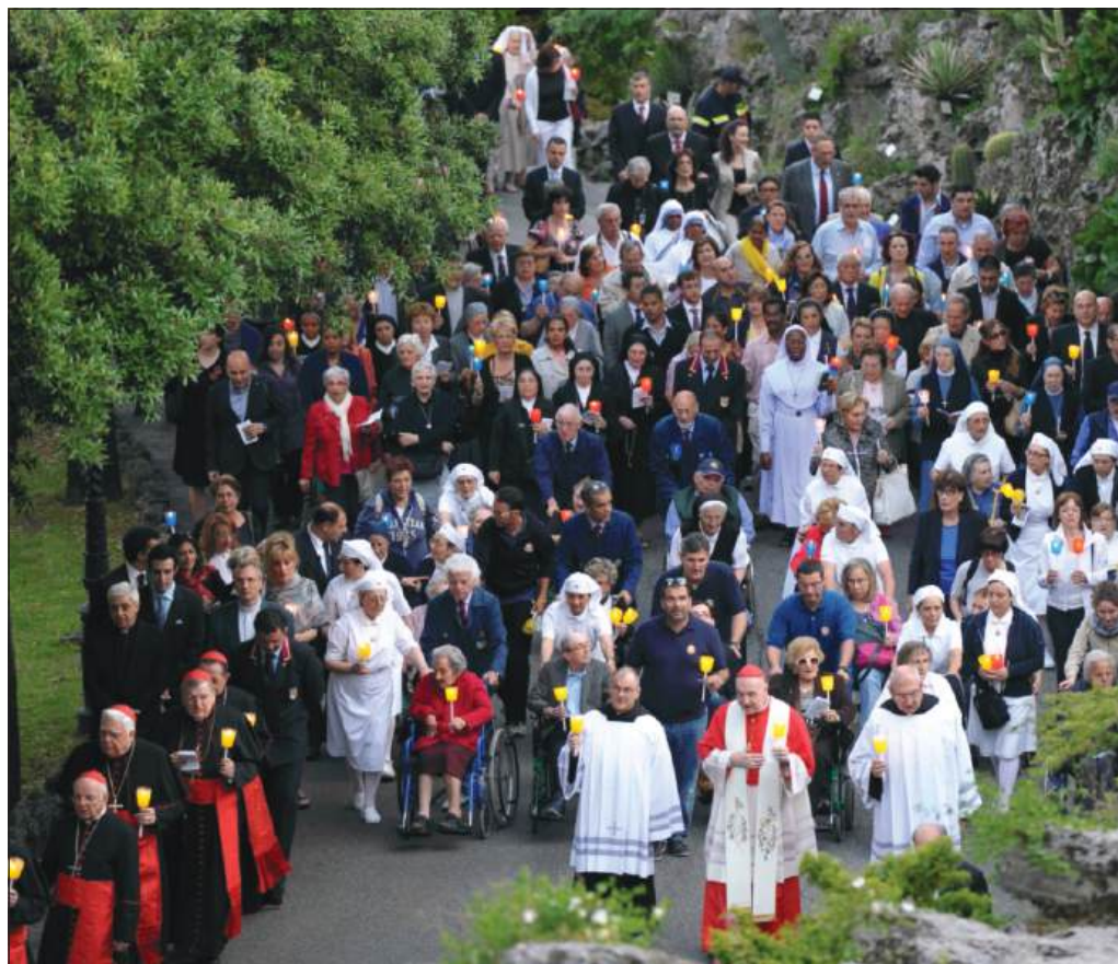
Modlitwa różańcowa w Ogrodach Watykańskich, 31 maja 2012 r.